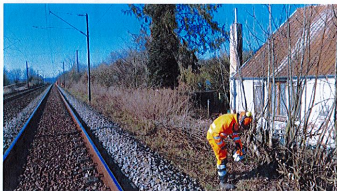
Illustration d'une intervention de maîtrise de la végétation, dans les Hauts-de-France, 2022

Conscient de la gêne occasionnée, SNCF Réseau vous remercie de votre compréhension en cette période de travaux.